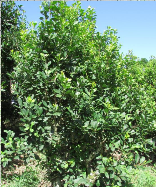
Planta da bebida oficial do Estado, agora possui plano de desenvolvimento estruturado.

A iniciativa estabelece diretrizes, objetivos e instrumentos voltados ao desenvolvimento sustentável da cadeia produtiva da erva-mate, contemplando desde a produção florestal até o processamento industrial, a comercialização e a valorização cultural do produto. Espera-se assim o estabelecimento de uma política pública estruturada, de caráter permanente, de apoio ao setor.