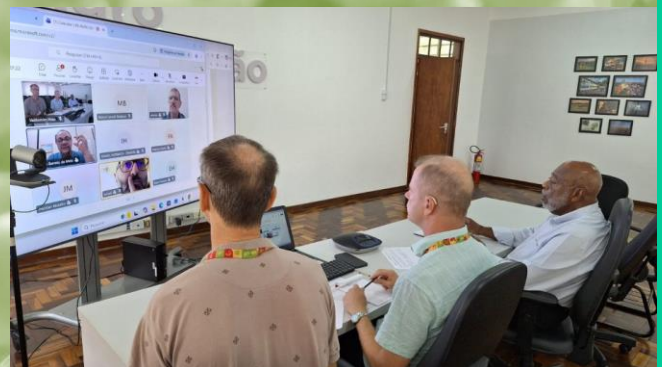
Integrantes reuniram-se virtualmente a partir da sede da SEAPI.

Os próximos encontros estão previstos para maio, setembro e dezembro, com possibilidade de ocorrerem no interior do Estado.