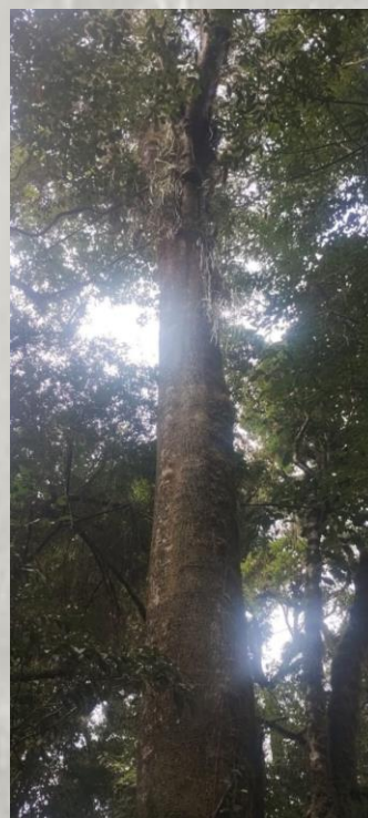
Exemplar Campeã, Caseiros, Polo Nordeste gaúcho.

Afinal, cada edição do concurso é mais do que uma competição: é um movimento coletivo pela biodiversidade e pelo futuro das nossas florestas.