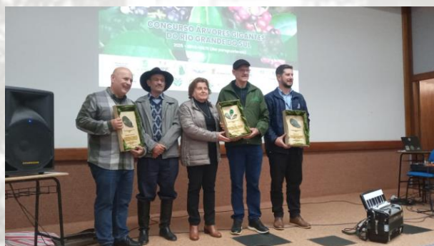
Premiação foi realizada na Universidade de Passo Fundo, idealizadora do concurso, em 1º de outubro de 2025.

Criado em 2023, o concurso tem como proposta valorizar árvores nativas do Estado, destacando sua importância ecológica, cultural e econômica. A cada edição, uma espécie é escolhida como protagonista: a primeira destacou a Araucária, e em 2025 foi a vez da erva-mate ( Ilex paraguariensis ), patrimônio cultural imaterial do Rio Grande do Sul. Além de premiar os maiores exemplares, a iniciativa busca identificar árvores de potencial genético para uso em programas de melhoramento e produção de mudas de qualidade, fortalecendo a cadeia produtiva e incentivando práticas de conservação.