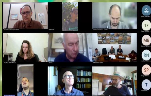
Integrantes reuniram-se virtualmente e presencialmente na sede da SEAPI.

Por fim, com espírito de união e otimismo, a reunião encerrou com a expectativa de que 2026 seja um ano de consolidação e inovação para a cadeia produtiva da erva-mate, alinhando qualidade, sustentabilidade e expansão de mercado