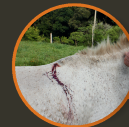
Exemplo de mordedura nos animais

Hábitos alimentares: alimentam-se do sangue de bovinos, equinos, suínos, ovinos e raramente de aves (galinhas), além de animais silvestres e exóticos (veados, capivaras e javalis). Na saliva são encontradas substâncias anticoagulantes que facilitam o escoamento do sangue.